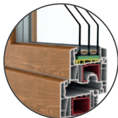
FEN 76 5S

System FEN 76 cechuje nadzwyczaj niski współczynnik przenikania ciepła. Dzięki temu można go zaadaptować do wymagań domów energooszczędnych. Elegancka (zaokrąglona w wersji 5R lub prosta w wersji 5S) forma profilu doskonale prezentuje się w dowolnej kolorystyce. Oferujemy szeroką paletę atrakcyjnych oklein, ponadto dzięki aluminiowym nakładkom na profile – możemy je polakierować na każdy z ponad 200 kolorów palety RAL. Wykonujemy także okna o nietypowym kształcie (w tym na bazie łuków) oraz drzwi tarasowe uchylno lub podnośno-przesuwne.